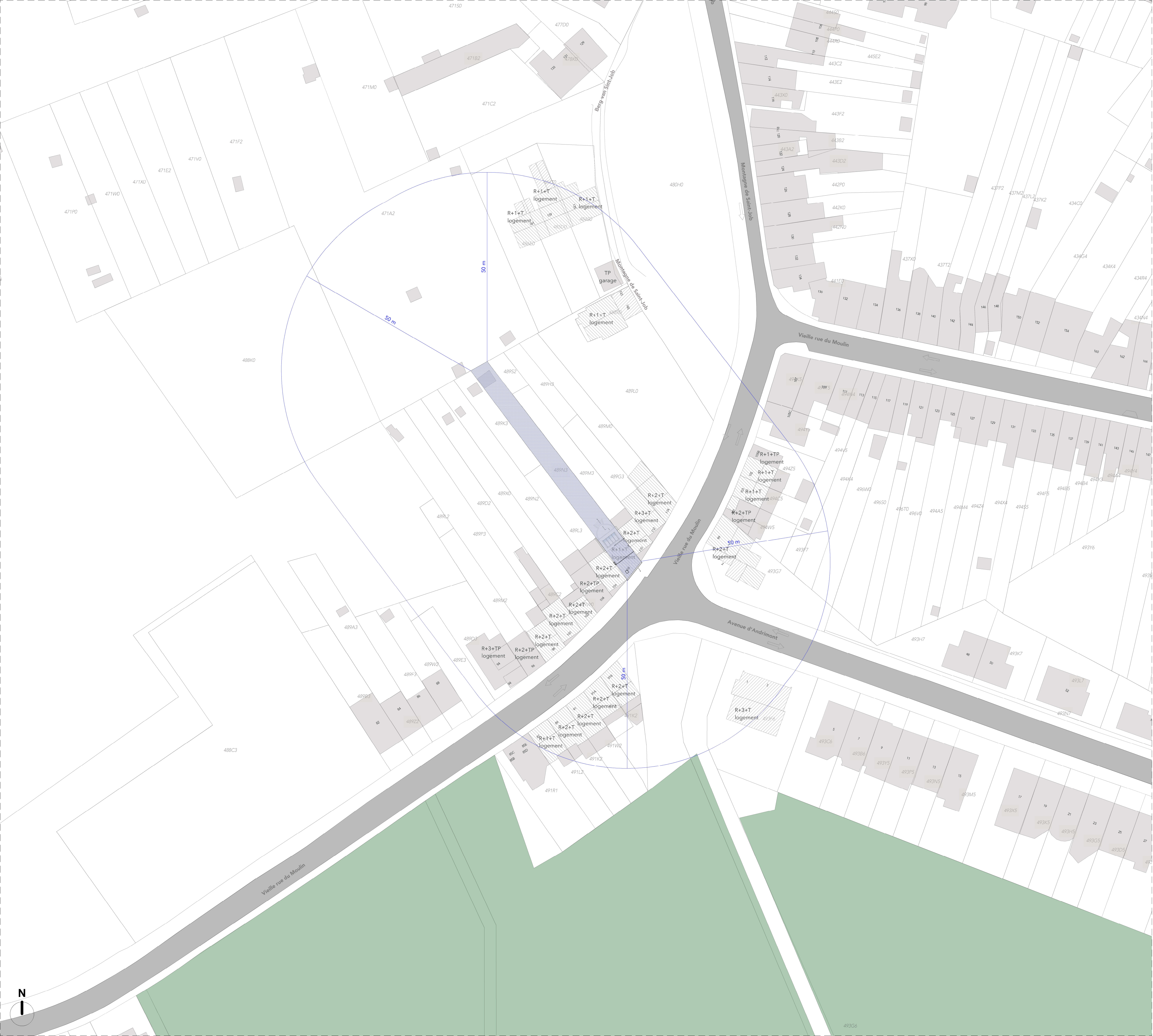
PLAN D'IMPLANTATION: SITUATIONEXISTANTE- ECH. 1/500